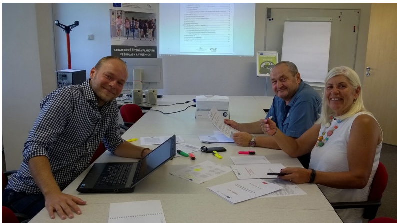
Kolegové z centra podpory v Olomouci

Toto video je užitečné nejen v rámci šablon, ale pomůže všem ředitelům, kteří aktuálně řeší nákup vybavení ICT do svých škol .