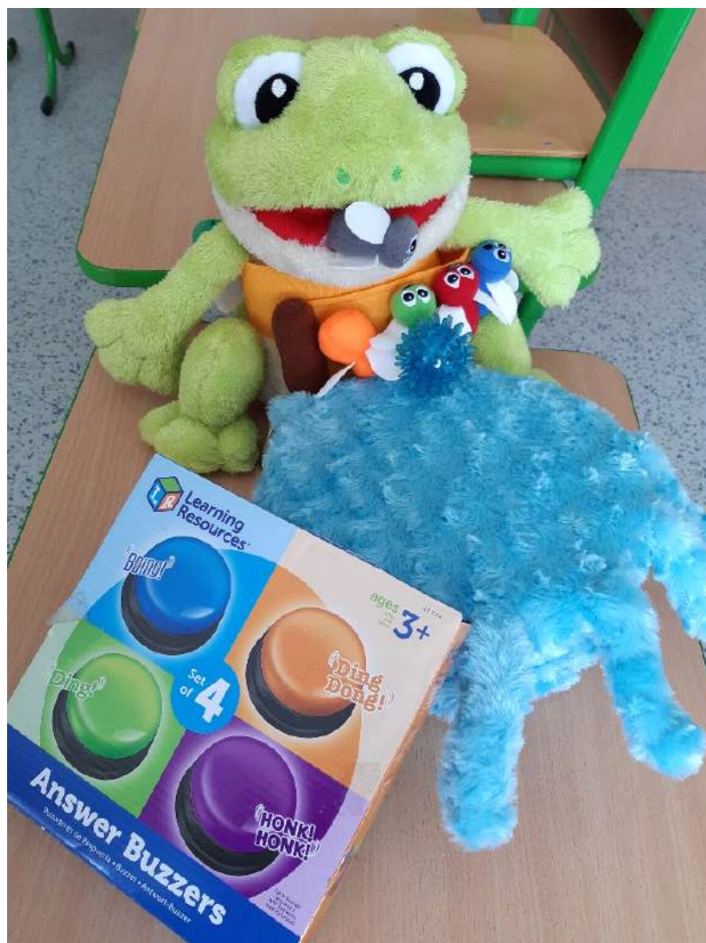
Strategický cíl č. 4 – Relaxační koutek pro žáky se SVP, nové pomůcky