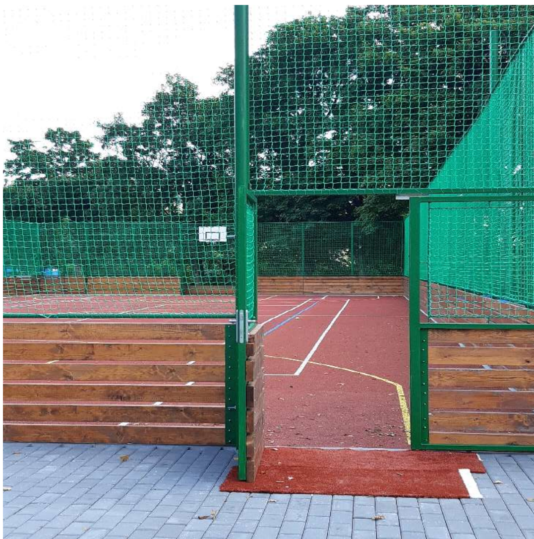
Strategický cíl č. 1 – Modernizace venkovních prvků – nové hřiště