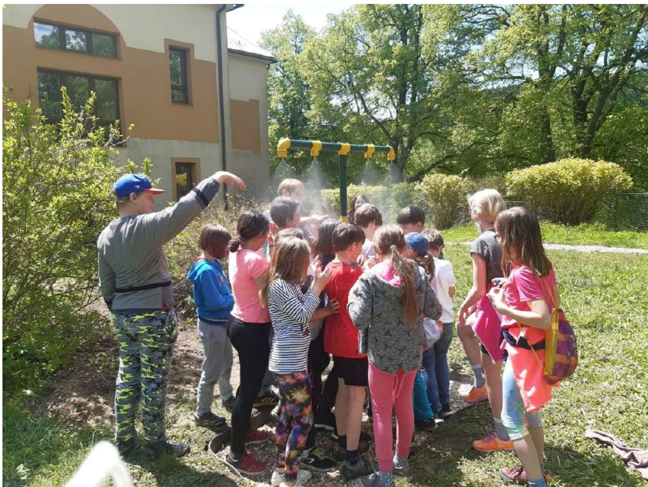
Strategický cíl č. 1 – Modernizace venkovních prvků – spuštění mlhoviště