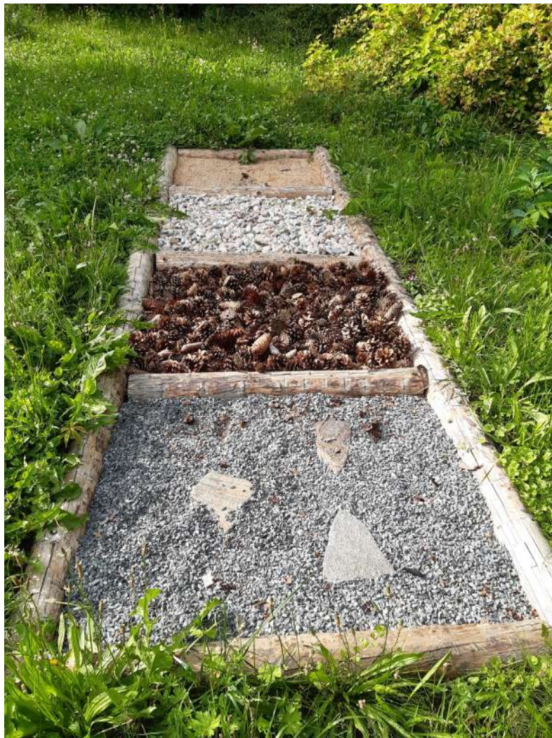
Strategický cíl č. 1 – Modernizace venkovních prvků – obnova hmatového chodníku